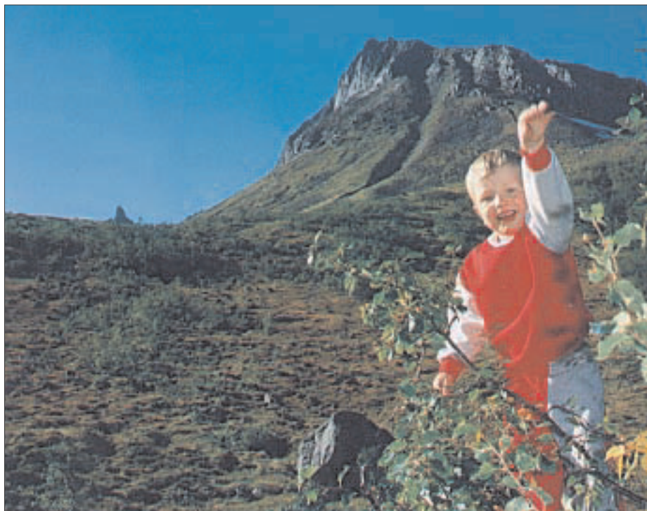
Nærleik til familie og ein storslagen natur er viktigaste trekkplaster for mange i Møre og Romsdal.

Det regionale mennesket i Møre og Romsdal vil ha kort arbeidsreise, men reiser gjerne lenger for å skaffe seg kulturelle opplevingar – eller for å handle. Dette er eitt av funna i prosjektet ”Jakta på det regionale mennesket - Om bulyst og regionale tilpassingar i Møre og Romsdal”.