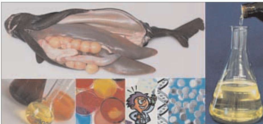
Lever, egg, mage og andre organer fra «haiens indre» kan være grunnlag for medisiner og helsekostprodukter.

Møreforskning har startet jakten på stoffer fra dyphavshai som kan gi gode helseeffekter. Arbeidsmetodikken kalles bioprospektering. En forsker har vært på studieopphold hos spesialister i New York og lært laboratoriemetoder for å studere stoffer som virker drepende på bakterier. Slike egenskaper er allerede påvist i flere organer fra hai. I samarbeid med Høgskolen i Ålesund har Møreforskning etablert en satsing for å bygge opp et felles kompetansemiljø i marin bioteknologi; Biotech Møre . En faggruppe på 12 personer er tilknyttet.