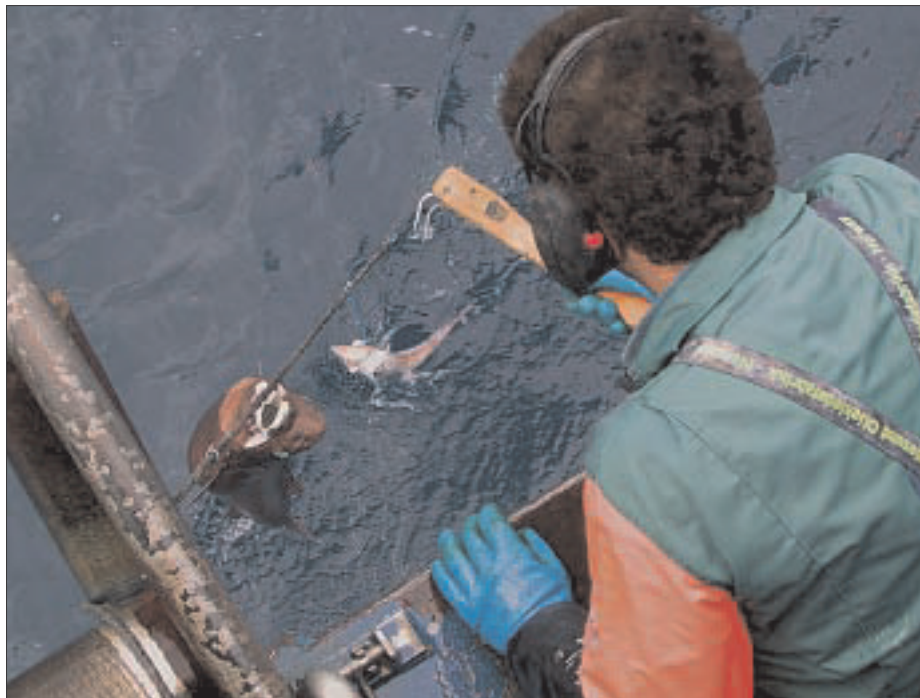
Brunhå og isgalt på lina ombord i M/S Leinebris.

Kommersialisering av dyphavsarter i norsk fiskerinæring har hatt et tverrfaglig fokus, med forsøksfiske og prosjektaktiviteter innen biologi, redskapsteknologi, produksjon, kartlegging av råstoffegenskaper og markedsutvikling.